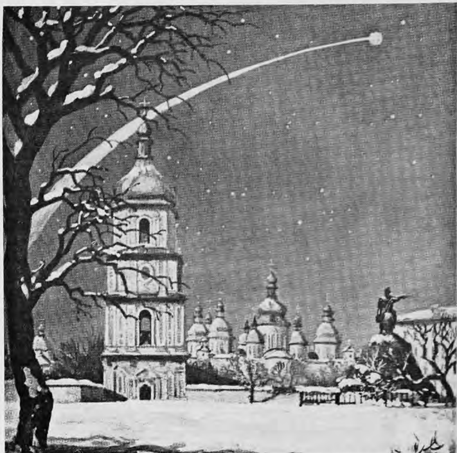
Собор Святої Софії у Києві — малюнок Василя Кричевського.

різьби на ньому, але всі старші звернули йому увагу, що там не вільно нічого торкатися.