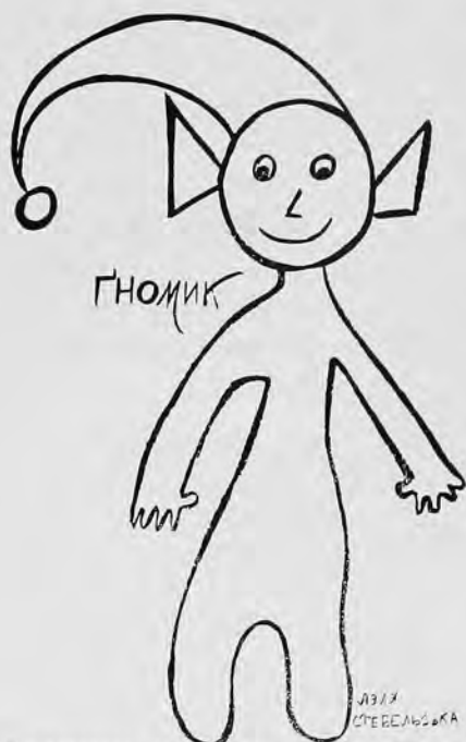
Малюнок із однойменної „Гомін з лісу”, малювала Ляля Стебельська.