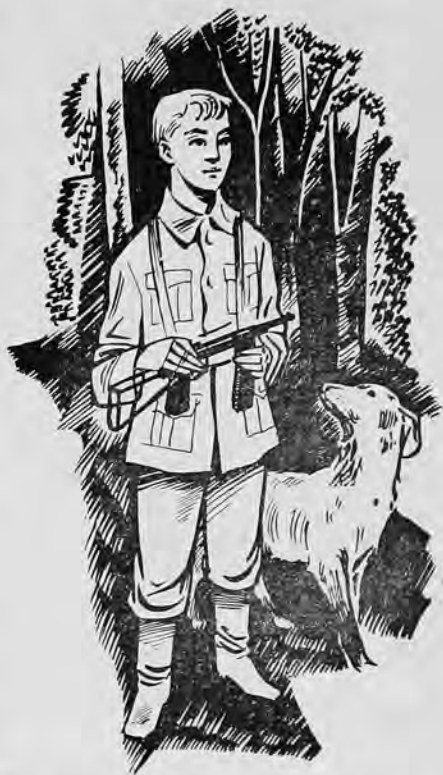
Малюнок М. Левицького із нового видання книжки „МИХАЙЛИК” М. Дмитренко.

те: він радіє, що незабаром піде знов поміж українських дітей? Та ми всі цим радіємо! Прошу вас, перекажіть Михайликові, що читачі „Готуйся” ждуть його дуже нетерпеливо! Багато з них вже читало його перше видання, а багато ще й не читало, бо були тоді ще маленькі. Але багато з тих, що вже його мають у своїх книгозбірнях, хочуть купити ще й друге видання. Хочуть побачи-