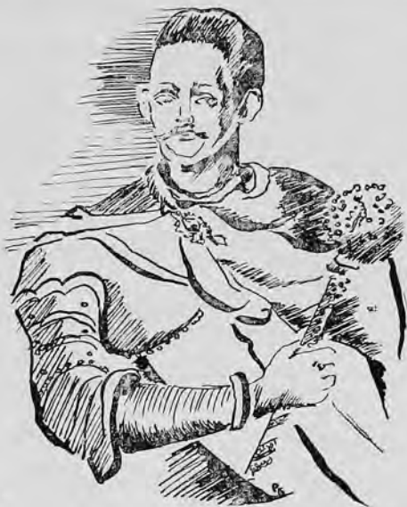
ГЕТЬМАН ІВАН МАЗЕПА

Знов Батурин збудувати, Привернути давню славу,