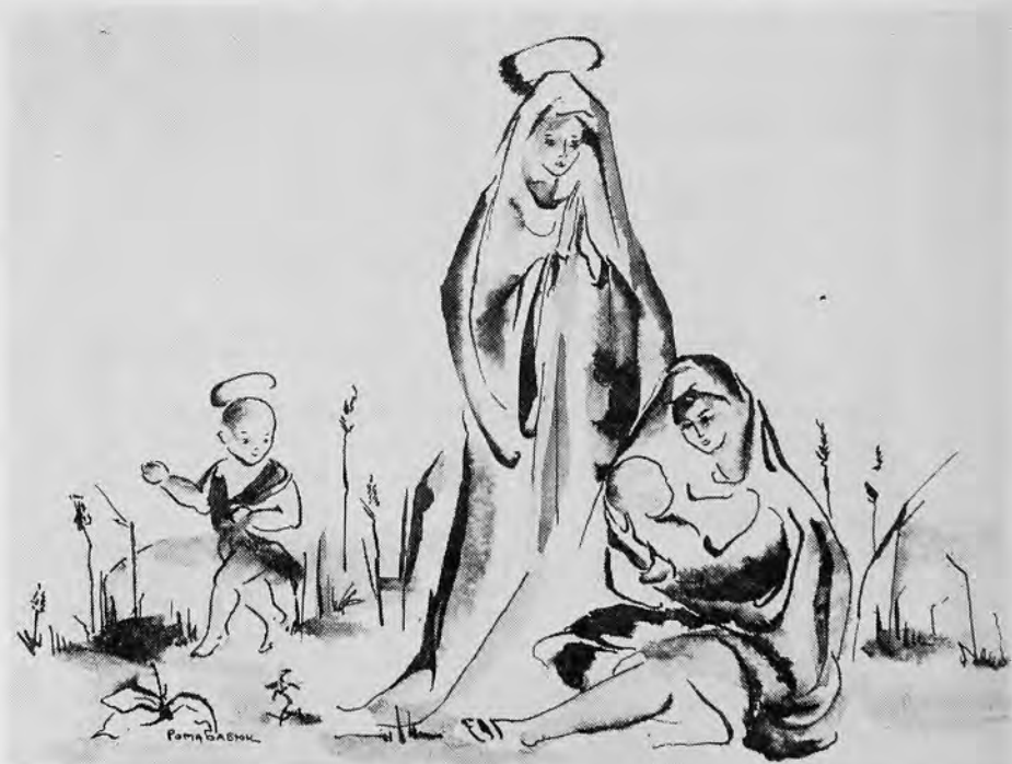
Мал. Р. Баб'юк

Що ж це так ворушиться на битому шляху? Невже ж гороб-