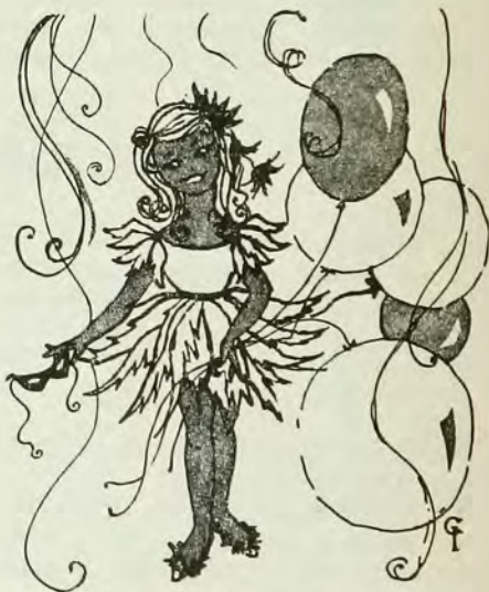
Мал. Ірка Стецьків

ОДЯГ ДИВО-КВІТКИ ПШИЛА ТАЛЯ ЖВАВО, БО ПІДУТЬ ОБИДВИ ВОНИ НА ЗАБАВУ!