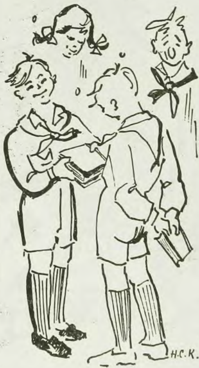
Мал. Н. Климовська

Українським звичаєм святкуємо не лиш уродини, але й ім'янини кожної людини. Уродини — це річниця уродин; ім'янини — це день святого, що його ім'я ця людина носить. У цей день ім'янинникові бажають всі друзі всього добра та співають „Многая Літа”.