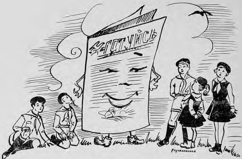
Мал. Р. Лучаковська