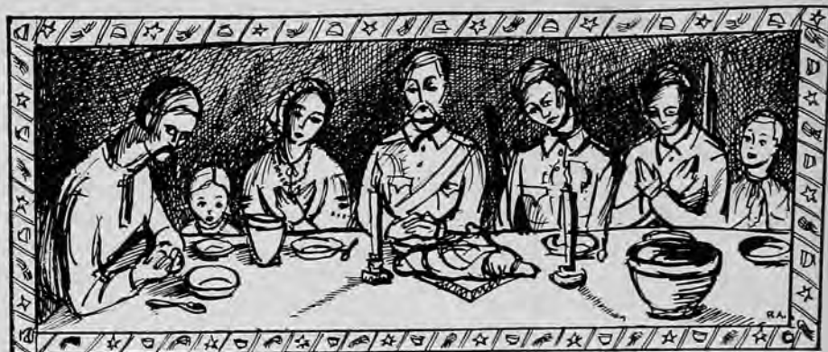
Братчик Тарас Когут