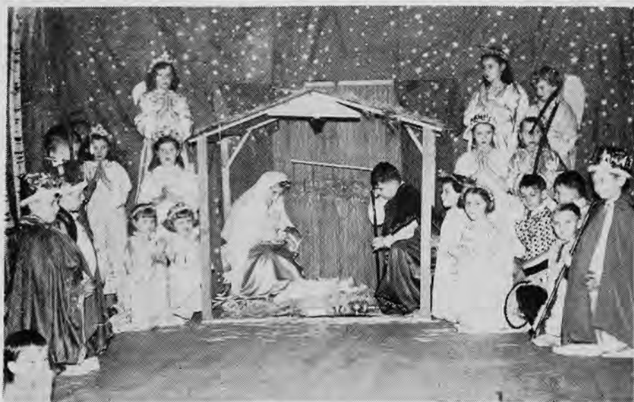
Новацький вертеп у Бостоні, Америка.