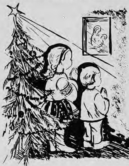
Мал. сестр. Ірка Савойка