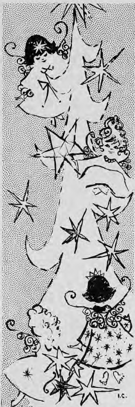
Мал. І. Стецьків

Архангел: О, це добре, що вже змалку приучується собі відмовляти, щоб другим допомогти! (Вішає зірку). За те оця