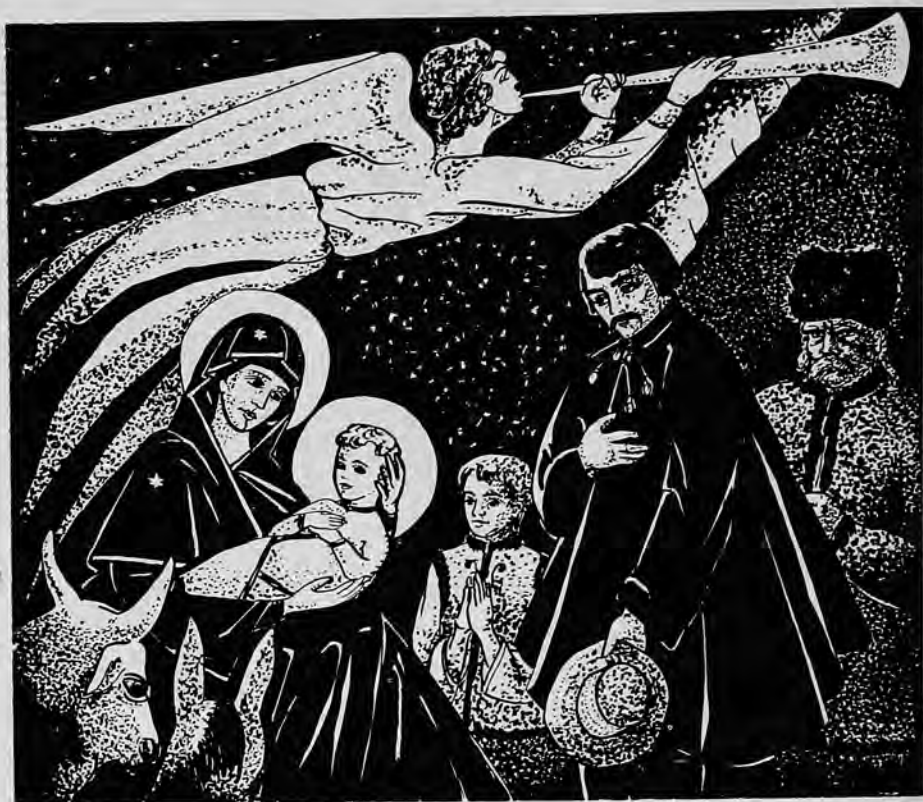
Бог Предвічний народився!