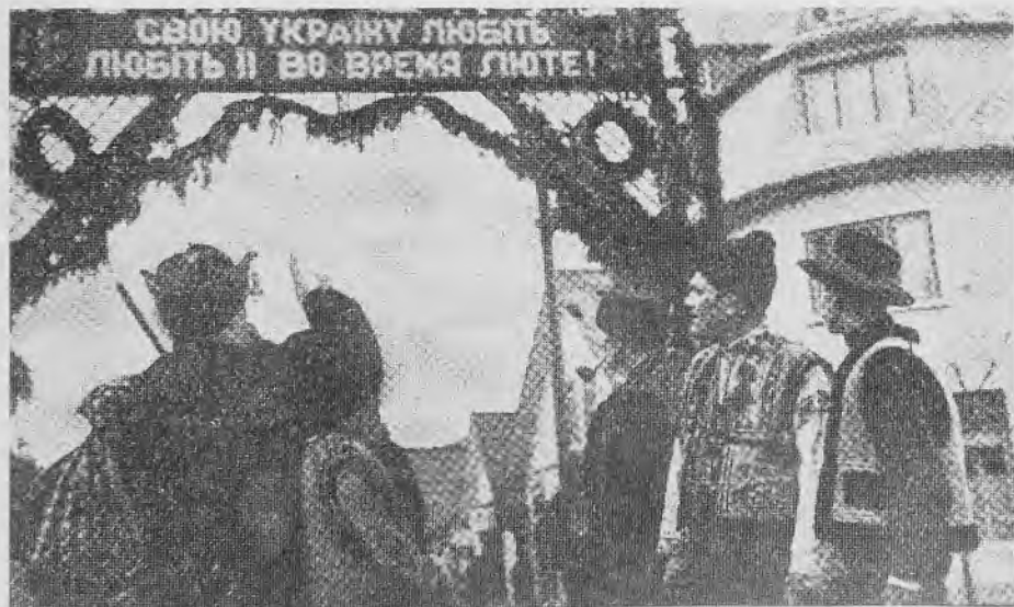
Так відбувалися в нашому Рахові вибори до Союму Карпатської України

А тепер сумно в нашому Закарпатті. Не виграють вже легіни на сопілках. Не йдуть люди із цілої Верховини на храм у село Богдан, як колись ходили. А большевики возять наших Гуцулів аж у далеку