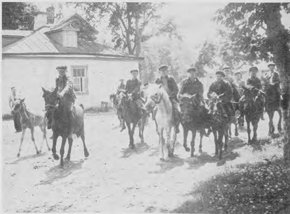
Хлопці на конях в одному з українських сіл на Київщині

Теперішні коні дуже різноманітні щодо вигляду, величини, барви та інших примет. Відповідно до