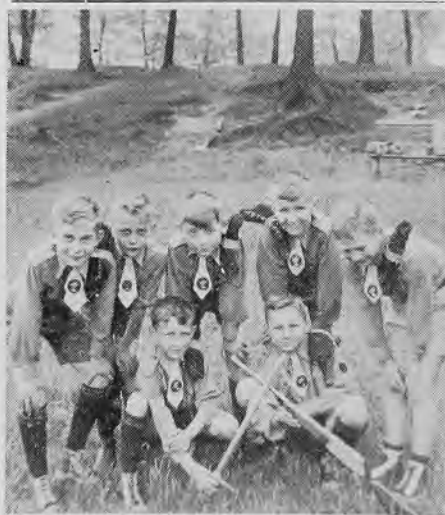
Новаци із Торонто перед грою в козаків.