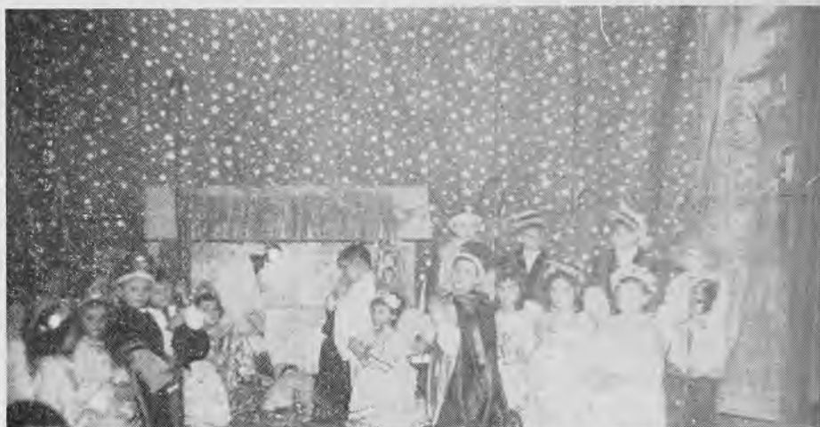
Вертеп у новаків та новачок у Бостоні, Америка.

ня із княжих часів або для новачка козарлюга.