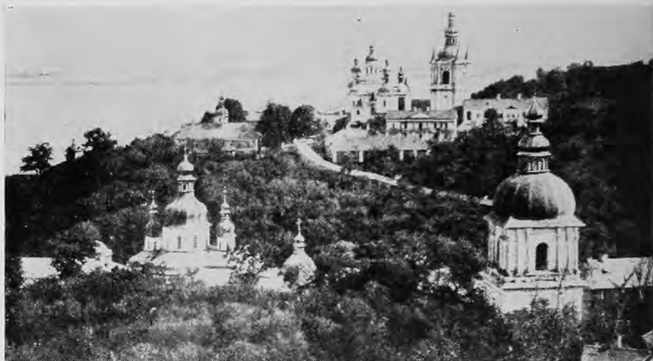
Печерська Лавра в Києві