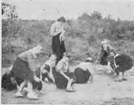
Спогади з таборів: Аргентина: готуємось до змагу.

Дякую нашій Сестричці за те, що на сторінках нашого журналу описала та познайомила широкий світ із нами — кількома