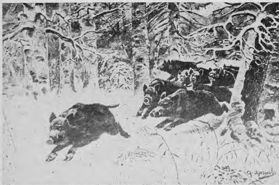
Стадо диків перебігає лісом

Дика свиня подібна до домашньої, тільки худа, хребет тонкий,