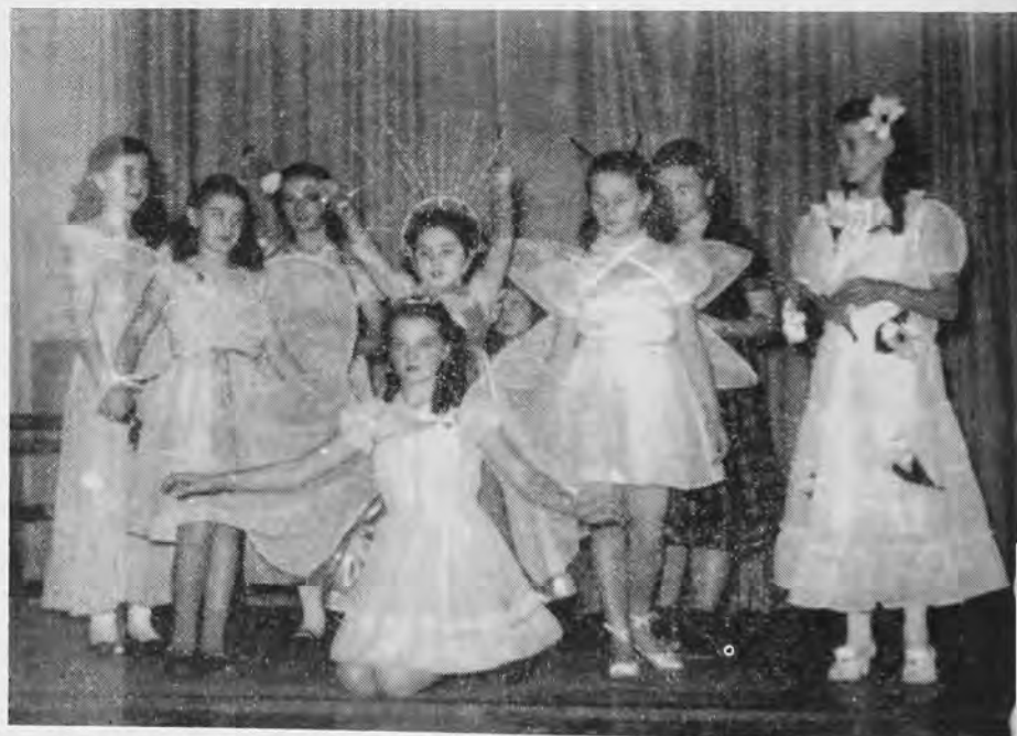
Спільне добре діло “Лісових Ягід” із Трентону ЗДА: новацька виставка на допомогу українським дітям в Німеччині.