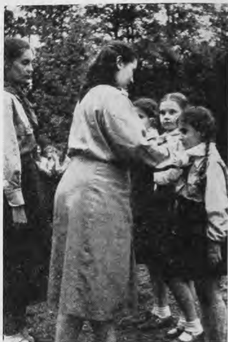
Дівчатка з Джерзі Ситі та Нью-арку дістають від сестрички жовті хусточки і тепер будуть вже справжніми новачками.

Та не тільки це. У своїх роях та гніздах Ви здобуваєте проби, складаєте іспити вмілостей, бавитесь весело, але чесно, за правилами,